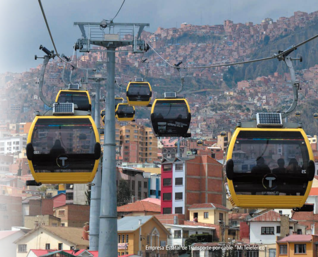
Empresa Estatal de Transporte por cable "Mi Teleférico"

La Contraloría avanza a la altura y vanguardia de los actuales desafíos que conlleva la implementación de las políticas públicas que buscan transformar el Estado boliviano.