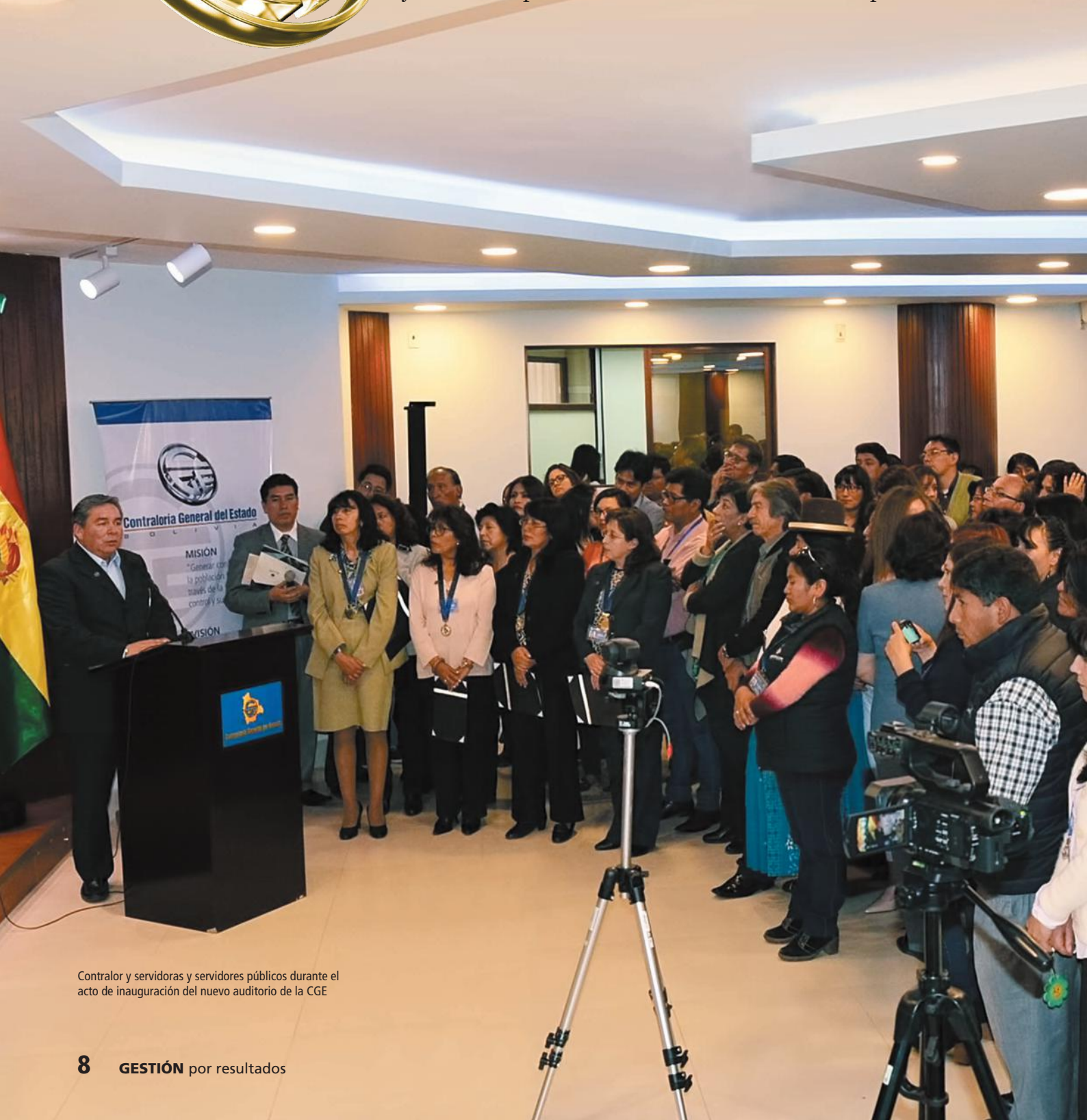
Contralor y servidoras y servidores públicos durante el acto de inauguración del nuevo auditorio de la CGE

En ocasión de la celebración de los 90 años de existencia la Contraloría General del Estado (CGE) inauguró su nuevo ambiente, lugar donde se realizó el acto en conmemoración que contó con la presencia del contralor general del Estado, Henry Lucas Ara Pérez, subcontralores, gerentes, servidoras y servidores públicos de la entidad e invitados especiales.