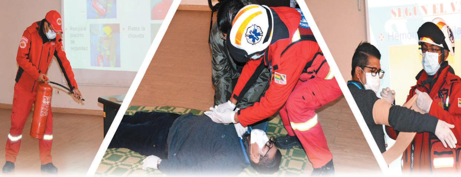
Funcionarios de la CGE durante la parte práctica del taller de Primeros Auxilios