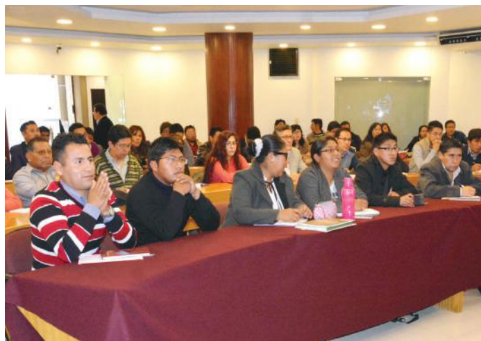
Taller de Supervisión y Planificación en el auditorio de la Contraloría General del Estado