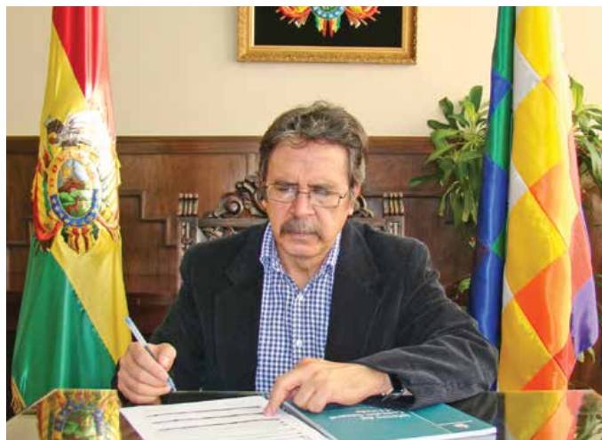
El Lic. Gabriel Herbas Camacho, Contralor General del Estado, inauguró el 3er. ciclo del programa "El Contralor Ciudadano".

La Paz (ANC) "El Contralor Ciudadano" es el nombre del programa de carácter institucional, de la Contraloría General del Estado, que se emite por tercer año consecutivo, por la señal nacional de Red Patria Nueva, una vez a la semana, los lunes de 16:00 a 16:45 hrs.