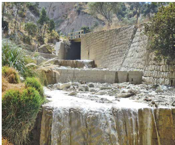
Aguas del río Cotahuma antes de confluir con el río Choqueyapu (Ingreso Cementerio Jardín).

La creciente preocupación por conservar y proteger el medio ambiente se ha traducido en una mayor repercusión informativa sobre los resultados de las auditorías ambientales realizadas por la Contraloría General del Estado, habiendo sido de reciente conocimiento público y seguimiento periódico, las últimas auditorías referidas a la contaminación atmosférica en las ciudades de La Paz y El Alto, así como