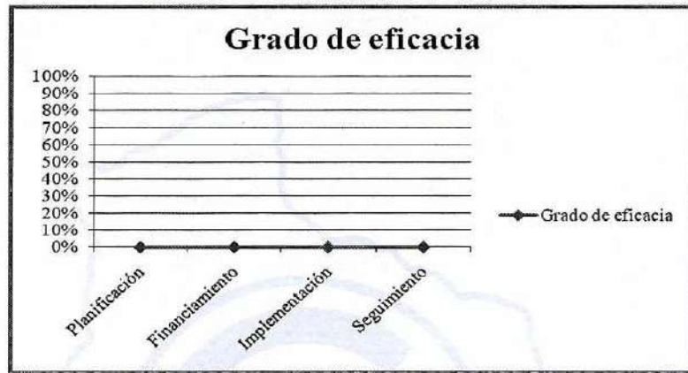
Grado de eficacia en la implementación del ODS 12.7 en el Estado Plurinacional de Bolivia Gráfico N° 1