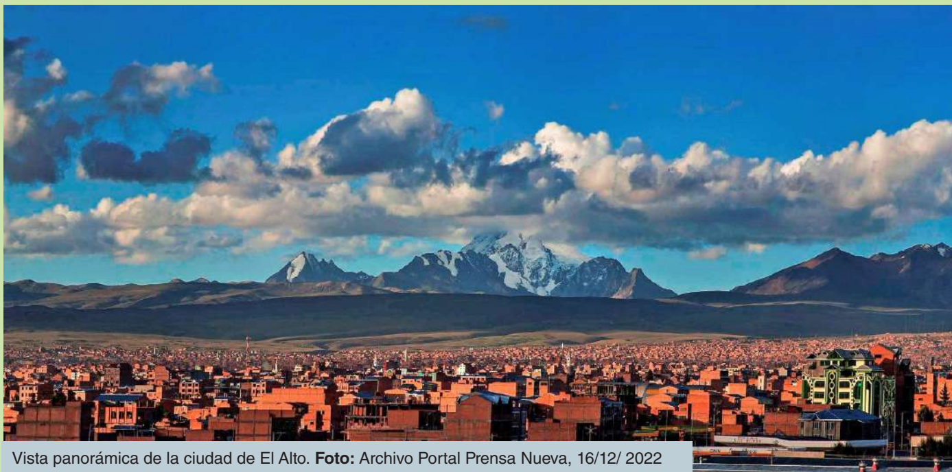
Vista panorámica de la ciudad de El Alto. Foto: Archivo Portal Prensa Nueva, 16/12/ 2022

Las supervisiones ambientales a la Gestión Integral de Residuos (GIR) desarrolladas por la CGE buscan coadyuvar en la mejora de las GIR, y esta a su vez prioriza la prevención en la generación de residuos, su aprovechamiento y disposición final. Continuando con esta línea de acción, la CGE presenta el Informe de Supervisión Ambiental a la Gestión Integral de Residuos en el Municipio de El Alto.