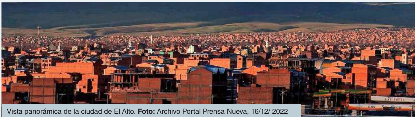
Vista panorámica de la ciudad de El Alto. Foto: Archivo Portal Prensa Nueva, 16/12/ 2022

El adecuado proceso de planificación de la Gestión Integral de Residuos identifica un estado situacional que se desea alcanzar en el futuro y las acciones necesarias para lograrlo. Además, implica un proceso razonado y sistemático que busca identificar las mejores acciones para prevenir y reducir la generación de residuos, maximizando el aprovechamiento de los residuos, minimizando la disposición final de los residuos, restringiendo en lo posible sólo para aquellos residuos no aprovechables.