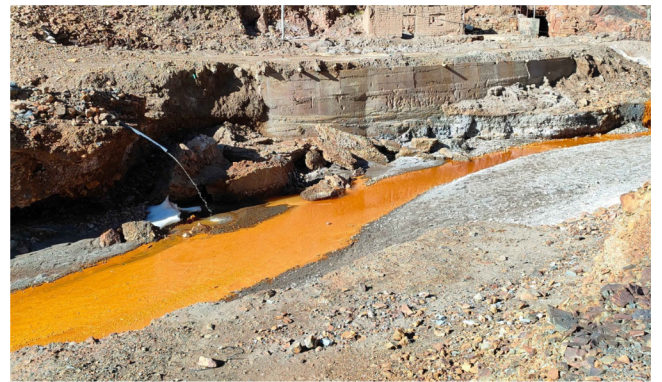
Descargas de Drenajes ácidos de minas en el lecho del río Huanuni, antes y después.